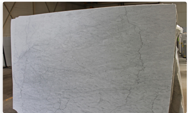
Ådring och färgdifferens