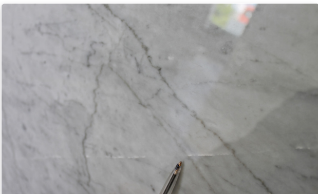
Krackeleringar under ytan