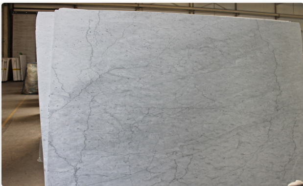
Ådring och färgdifferens

När det gäller marmorns utseende och egenskaper enligt ovanstående kan vi tyvärr inte godkänna reklamationer. Jetstone påtar sig inte heller något ansvar beträffande produkttegenskaperna hos detta material. Jetstone rekommenderar bänkskivor av komposit, keramik eller Dekton som tåligare alternativ till marmor.